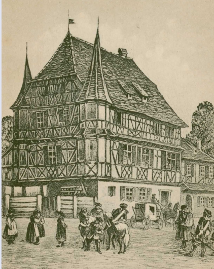
La maison où fut signée la capitulation de Strasbourg a été rasée dans les années 1930.