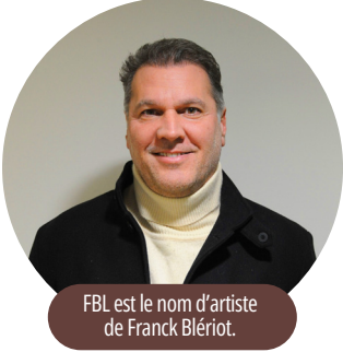
FBL est le nom d'artiste de Franck Blériot.

Il y a un peu plus d'un an, l'atelier d'art Métamorphoze s'est installé au Parc d'Innovation. Fondée par le peintre strasbourgeois Franck Blériot, la société est spécialisée dans la réalisation de fresques murales monumentales. Des œuvres visibles au sein d'entreprises et de collectivités publiques, essentiellement en France et en Europe.