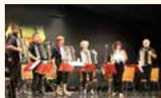
Accordéon-Club de Saverne