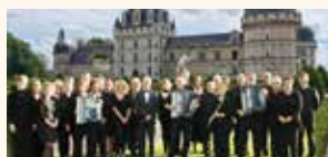
Association Culturelle et d'Accordéons de Gunstett et l'Ensemble d'Accordéons de l'Ill