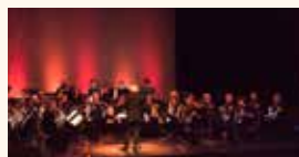
Ensemble d'Accordéons de Vendenheim et Société d'Accordéonistes de Wissembourg